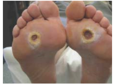
Bild 2: Ausgeprägtes Diabetisches Fußsyndrom

Herkunft, Entwicklungsstand, Schutzrechte: Die Entwicklung kommt aus dem Institut für Biomechanik einer Universität in Israel. Leiter des Instituts und treibende Kraft bei der Entwicklung des neuen Scanners ist ein jüngerer Wissenschaftler, der bereits eine Reihe